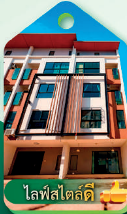
ไลฟ์สไตล์ดี